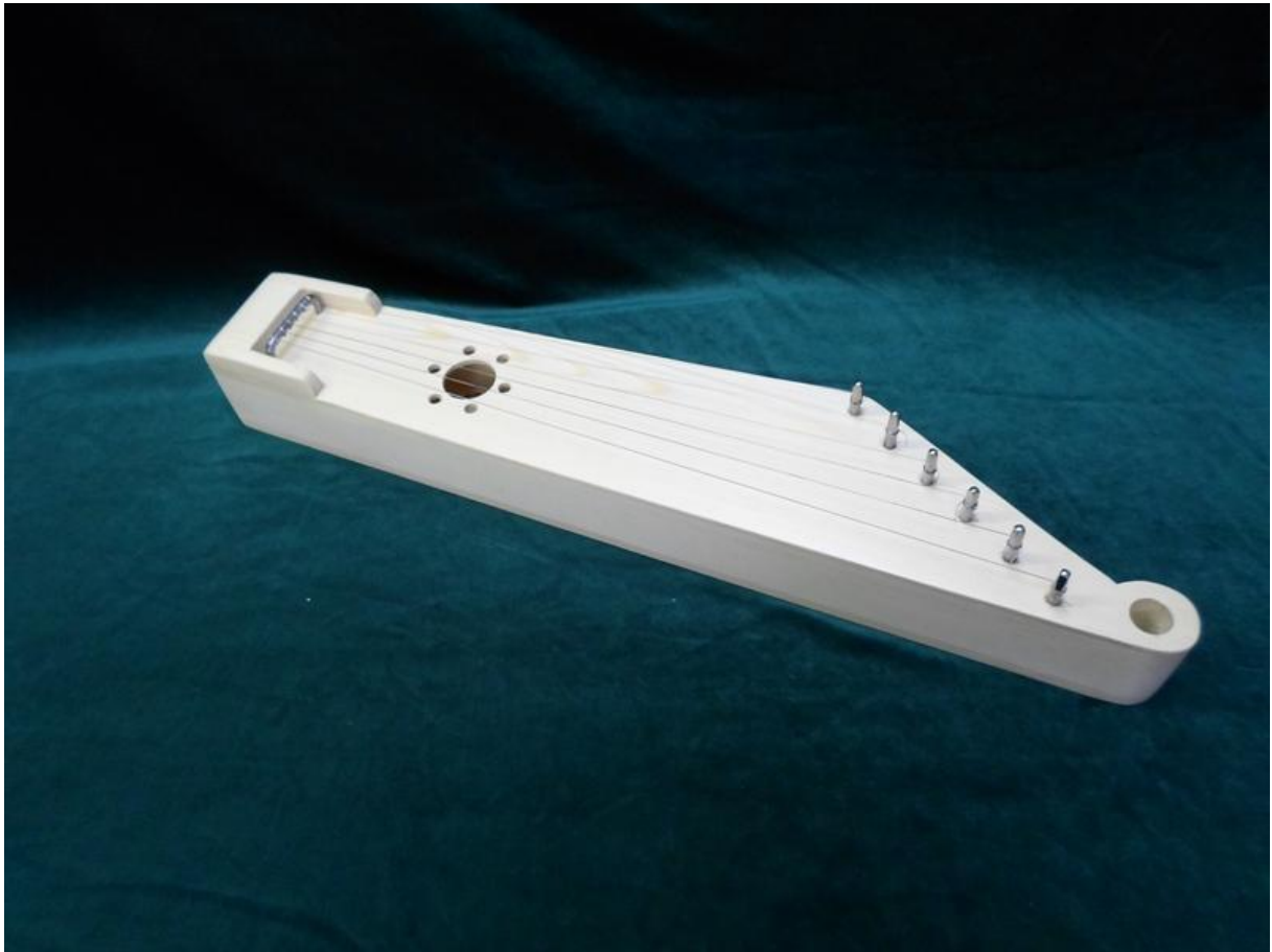
Joonis 1. Valmimisjärgus väikekannel.